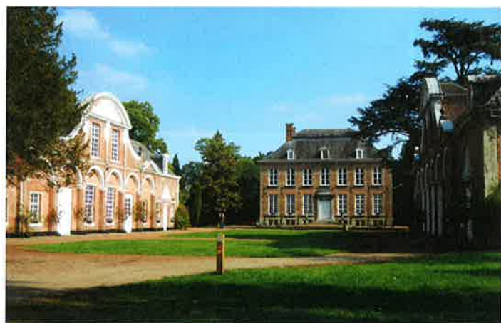
Het kasteel van Berlare met bijgebouwen.

B&B's, campings en vakantiehuizen in de buurt op de website van Toerisme Berlare