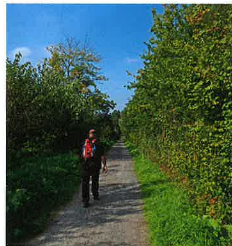
Wandelen in Berlare Broek.

bomen worden hier ongemoeid gelaten, tenzij ze een gevaar vormen voor de wandelaars. In de omgevallen boomwortels kunnen zich namelijk kleurige ijsvogeltjes nestelen. Via een houten brugje verlaten we het Donkmeer, om koers te zetten naar het natuurlijk overstromingsgebied van de Schelde ten zuiden van Berlare. Eerst passeren we nog het Riekend Rustpunt, het kleinste museum van Vlaanderen. Maar je moet wel goed opletten, je bent er voorbij voordat je het beseft (net als wij). Het gebouwtje herbergt een permanente tentoonstelling – in geuren en kleuren – over de mesthandel waar Berlare bekend voor was. Voordat men overging