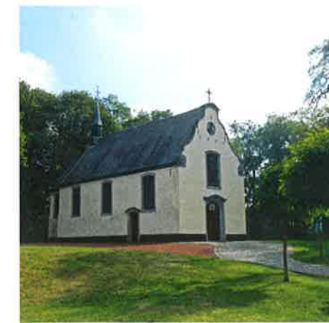
De Baredonkkapel kijkt uit over de omgeving.

Toerisme Oost-Vlaanderen schenkt 5 exemplaren van de kaart van het wandelnetwerk Kalkense Meersen – Donkmeer om te verloten onder de juiste inzendingen op de volgende vraag: Hoe heet het museum waar je alles te weten komt over mest? Stuur je antwoord voor 1 december naar het VWO-secretariaat, Charles de Kerchovelaan 11, 9000 Gent of via e-mail aan info@vwofederatie.be . Vergeet zeker niet je naam en adres te vermelden. Je vindt de winnaars in de rubriek 'Kortweg' van de volgende Wandelvogel. Succes!