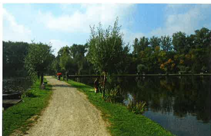
Over de dam wandel je naar de overkant van het Donkmeer.