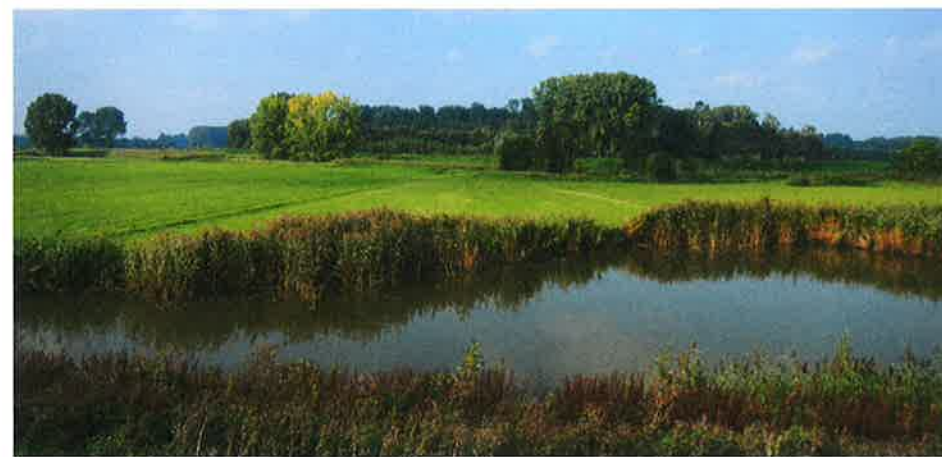
Prachtig vergezicht over het overstromingsgebied van de Schelde.

tot het gebruik van guave en mestpoeder was mest namelijk een waardevol product. Zo waardevol, dat champetters blijkbaar ooit boetes uitdeelden aan koeienstrontrapers. Tijdens het wandel- en fietsseizoen kan je er elke namiddag vrij binnenwandelen, buiten het seizoen is het toegankelijk voor groepen na afspraak.